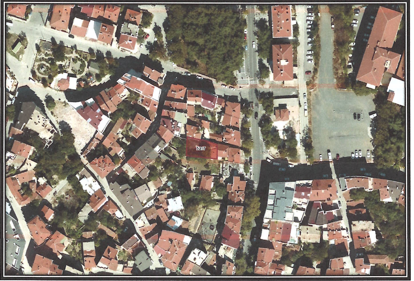
Şekil 1-Proje Alanını Gösterir Uydu Görüntüsü

Planlama alanı Tekirdağ İli, Süleymanpaşa İlçesi, Zafer Mahallesi sınırları içerisinde 52 ada 7 parsel sayılı taşınmazı kapsamaktadır.